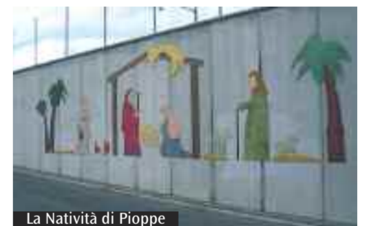
La Natività di Pioppe