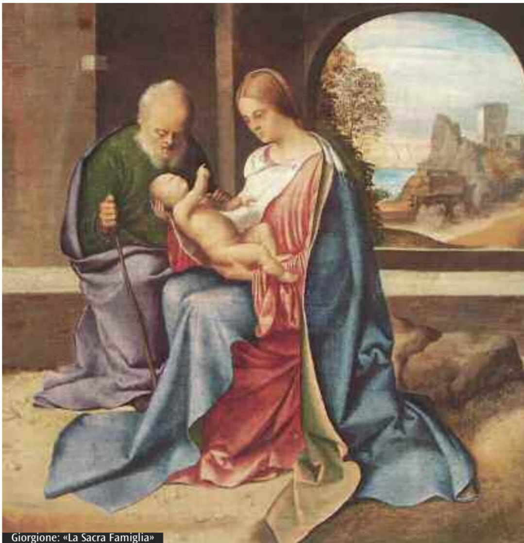
Giorgione: «La Sacra Famiglia»