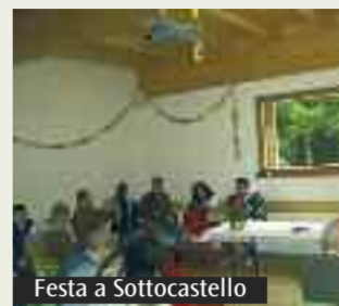
Festa a Sottocastello

e lo stupore dei pastori. Il giorno di santo Stefano arriveranno da Bologna tanti altri amici che trascorreranno con noi le loro vacanze; con loro andremo a visitare i presepi artistici del Cadore, potremo pattinare sul ghiaccio e, se ci sarà, camminare e giocare sulla neve. Il Natale è anche un momento che ci permette di fermarci, di pensare alla nostra vita e a quella della nostra comunità, di pregare per avere la forza di affrontare le difficoltà che ci aspettano. Per tutto il tempo in cui saremo insieme in montagna ci accompagneranno le parole di don Tonino Bello che abbiamo inserito negli auguri che abbiamo spedito ai nostri amici: «Buon Natale, amico mio: non avere paura. La speranza è stata seminata in te. Il Natale ti porta un lieto annuncio: Dio è sceso su questo mondo disperato. E sai che nome ha preso? Emmanuele, che vuol dire: Dio con noi. Coraggio, verrà un giorno in cui una primavera senza tramonto regnerà nel tuo giardino, dove Dio, nel pomeriggio, verrà a passeggiare con te».