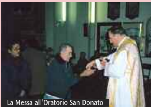
La Messa all'Oratorio San Donato