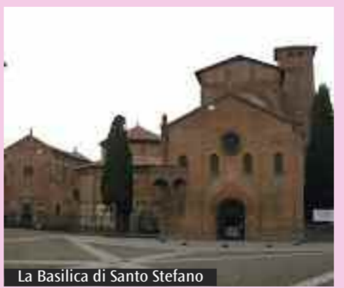
La Basilica di Santo Stefano