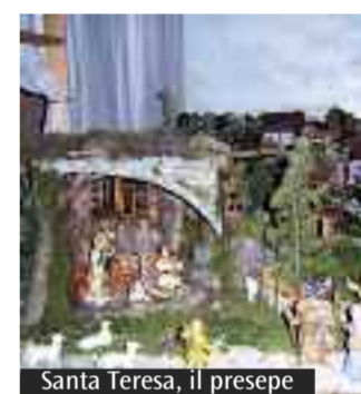
Santa Teresa, il presepe

Internet: abbiamo incontrato padre Pizzighini, che ci ha parlato appunto del 7° incontro mondiale e monsignor Ottani, che ci ha parlato de «Il lavoro». Da un po' di tempo facciamo anche da soli, consapevoli del fatto che il Papa vuole che si possa conciliare lavoro e festa in una famiglia unita e aperta alla società e alla Chiesa. Anche stanotte, la notte di Natale, ci sarà una veglia di attesa della Messa di mezzanotte animata dal Coro giovani e dal Coro adulti (50 persone): i bimbi (20) giocheranno e danzeranno sul ritmo dei canti, mentre ci sarà la proiezione dei testi dei tempi del Forum con immagini d'arte corrispondenti (l'annuncio, la nascita, la Sacra Famiglia, il lavoro e la festa). Il cammino ora s'è fatto spedito e si cercano contatti e risorse: si