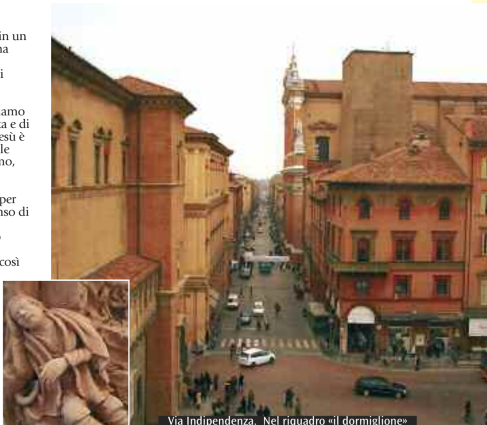
Via Indipendenza. Nel riquadro «il dormiglione»