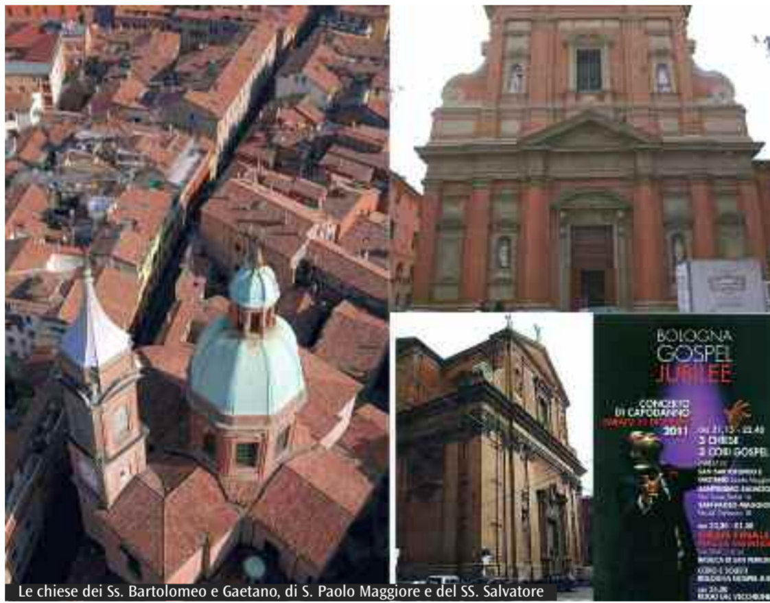
Le chiese dei Ss. Bartolomeo e Gaetano, di S. Paolo Maggiore e del SS. Salvatore