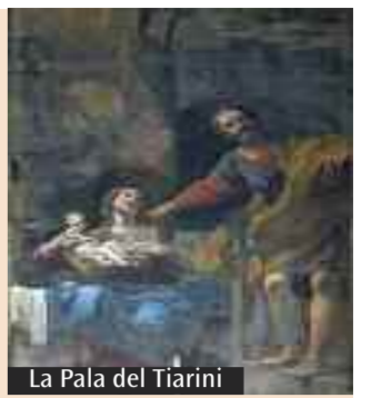
La Pala del Tiarini

Lo scoccare della mezzanotte sarà preceduto da tre concerti in altrettante chiese del centro