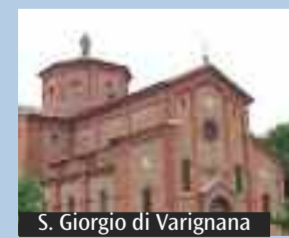
S. Giorgio di Varignana

provengono da chi non ha provato lo stesso strazio. Anche la speranza sembra morire: non si vedono più prospettive». «Solo la testimonianza di chi ha attraversato lo stesso dolore - prosegue Di Salvo - e ha riconquistato spazi di serenità e soprattutto una prospettiva di speranza, è efficace: lo abbiamo constatato. E anche per chi aiuta, è molto importante e costruttivo rendersi conto che il proprio dolore non solo è affrontabile, ma può diventare fecondo sostenendo altri». «Ora la notizia delle due gravidanze ci dà la prova che la nostra opera è valida - conclude la responsabile - Ma è importante capire quello che ci ha detto un giovane padre recentemente: "Il confine fra il ricominciare a vivere e il lasciarsi andare alla disperazione è sottile. Se non avessi trovato aiuto, probabilmente mi sarei lasciato andare, mentre ora sono una persona migliore". Insomma, non si possono affrontare simili dolori da soli: bisogna chiedere aiuto». Per informazioni, telefonare al 340361459 o inviare una mail a casamarella@gmail.com