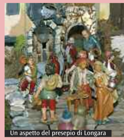
Un aspetto del presepio di Longara