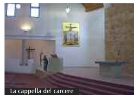
La cappella del carcere