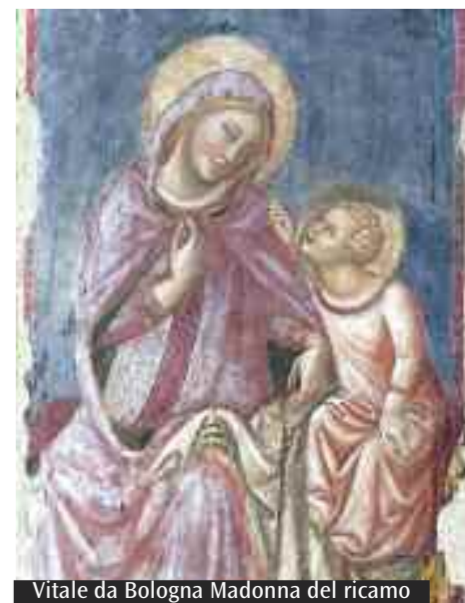
Vitale da Bologna Madonna del ricamo