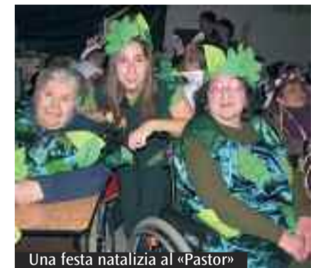
Una festa natalizia al «Pastor»

Dal 27 dicembre al 6 gennaio il Villaggio senza barriere Pastor Angelicus indosserà il «vestito della festa». In questo tempo di Natale, tempo della gioia, della luce, della famiglia, ci ritroveremo, persone di età e condizioni di vita diverse, per preparare insieme la festa dell'ultimo dell'anno e dell'Epifania. Con la collaborazione di tutti, al Villaggio si ripeterà, in questi giorni, lo straordinario miracolo della «simpatia e amicizia secondo il Vangelo» che crea comunione nella fede e nella carità. bambini, giovani, adulti e anziani, persone disabili e non, condividendo nella gratuità la loro originale presenza e i loro doni diversi, daranno vita, la sera dell'ultimo dell'anno, ad un unico grande e divertente spettacolo in cui ognuno sarà prezioso e indispensabile per contribuire alla gioia di tutti. Quest'anno ripercorreremo «i migliori anni della nostra vita» facendo incontrare epoche e realtà diverse (figli, genitori e nonni... chissà cosa si diranno!!!) per riscoprire, attraverso sketch, musiche e balletti originalissimi e divertenti, che il tempo migliore per ciascuno è il tempo che ci è dato, qui ed ora, per sperimentare e condividere l'immensa gioia dello stare insieme agli altri e a quel Dio che ha scelto di farsi carne