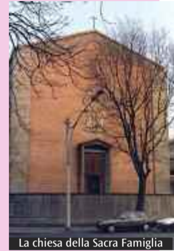
La chiesa della Sacra Famiglia