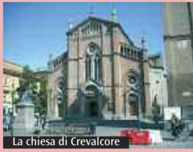
La chiesa di Crevalcore