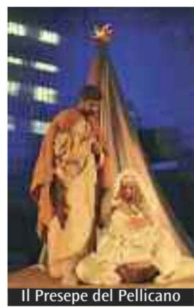
Il Presepe del Pellicano