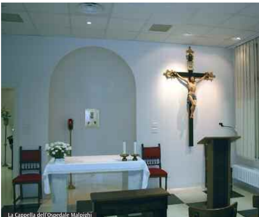
La Cappella dell'Ospedale Malpighi

Chi è ricoverato in ospedale vive il suo tempo, interminabile, nell'attesa del ritorno alla casa, agli affetti, alle piccole, meravigliose abitudini di ogni giorno, spesso nel tormento del dubbio e dell'angoscia sul suo futuro. In questo periodo che precede le festività natalizie, si aggiunge un'altra domanda: come e dove passerò il Natale? Nella mia casa, vicino ai miei cari, o resterò qui, nella stanza semivuota del reparto, tra il personale ridotto al minimo indispensabile per le necessità vitali? E se andrò a casa, quale sarà la mia vita? Sarà accettabile per me e per i miei cari? La scadenza delle festività imminenti rende più cruda e urgente la problematica quotidiana del malato... In questo contesto si capisce come sia ancor più necessaria una presenza umana e solidale, che sostenga la speranza e, testimoniando un'attenzione, faccia sentire il malato al centro di un affetto, che gli possa dare la forza di attendere e di credere ancora. In questo contesto si inserisce la Messa che il provicario generale monsignor Gabriele Cavina celebrerà domani, giorno di Natale, alle 10.30 nella Cappella dell'Ospedale Malpighi.