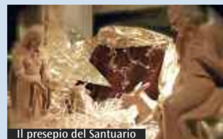
Il presepio del Santuario

In questi giorni natalizi presso il Santuario del Corpus Domini (via Tagliapietra 21) ci saranno diversi momenti. Si comincia oggi alle 10 nella Sala S. Caterina con il «Claustro di Natale», meditazione sul Natale; a conclusione, brindisi e scambio di auguri. Alle 23.30 Messa della vigilia di Natale. Domani alle 11.30 Messa del giorno e alle 17.30 «In dialogo con Gesù. Adorazione eucaristica di Natale», accompagna al