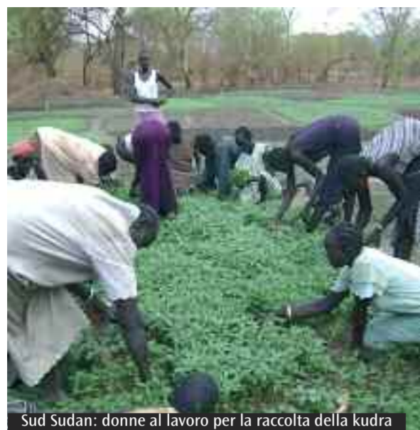
Sud Sudan: donne al lavoro per la raccolta della kudra